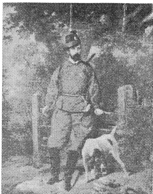
Carl XV. Oljemålning av C.F.Kiörboe