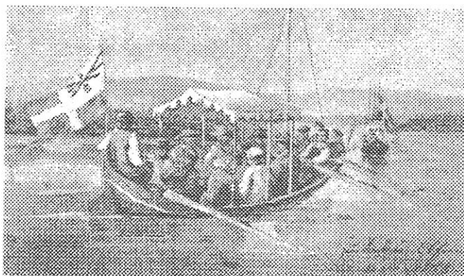
Akvarell av F.v.Dardel

På Svartlå bruk intogs frukost hos inspektör Eckhéll, och kronprinsen tog en teckning av den vackra omgiv- ningen. Från Bredåker var man hänvisad att begagna sig av båtar, ty där upphörde älvlandsvägen vid denna tid. Emellertid fanns säkerligen ingen anledning att beklaga det nya färdsättet, ty Lule älvs dalgång erbu- der även på detta avsnitt vyer av både tjugande och imponerande art, vilka torde till fullo ha uppskattats av kronprinsens konstnärsöga. I Edefors hade resenärerna tillfälle att bese den ståtliga försen och det här pågå- ende laxfisket, varefter båtfärden fortsatte från Övre Edet till Wuollerim, dit man anlände sent på natten.