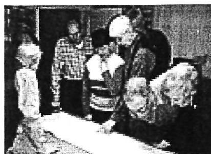
Högsöns by under luppen