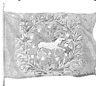
Kompanifana modell 1686.

Efter kungens död i Norge sändes Västerbottens regemente till Göteborg, som förstärkning till garnisonen därstädes. Först försommaren 1719 nådde man hemorten, som man hade att försvara mot ryska strandhugg. Tyvärr var det inte mycket man lyckades åstadkomma och år 1720 brändes Umeå med omnejd av en rysk landstigningskår. Nästkommande sommar återvände en rysk mordbrännarflotta och skövlade hela Norrlandskusten ända upp till Piteå, där både den nya och gamla staden, med överstebostället Gran, blev lågornas rov den 14 juni. Lulebygden räddades tack vare att de svenska fredsförhandlingarna lyckades förmå tsaren att dra tillbaka flottstyrkan. Strax därpå slöts fred i Nystad.